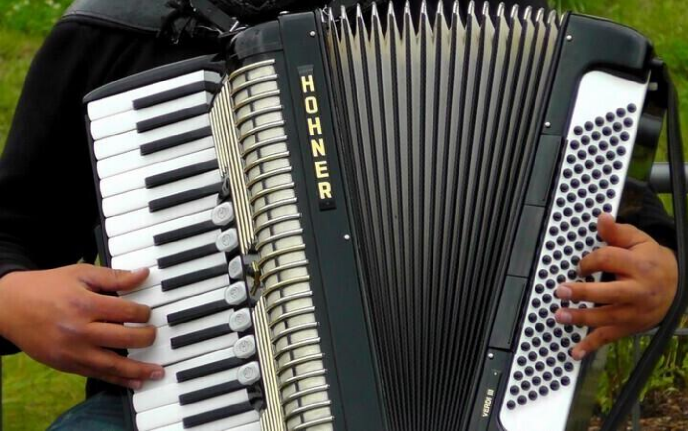
Thé chantant 38160 Saint-Marcellin Thé chantant, variété française Plus d'infos mar. 10 mars