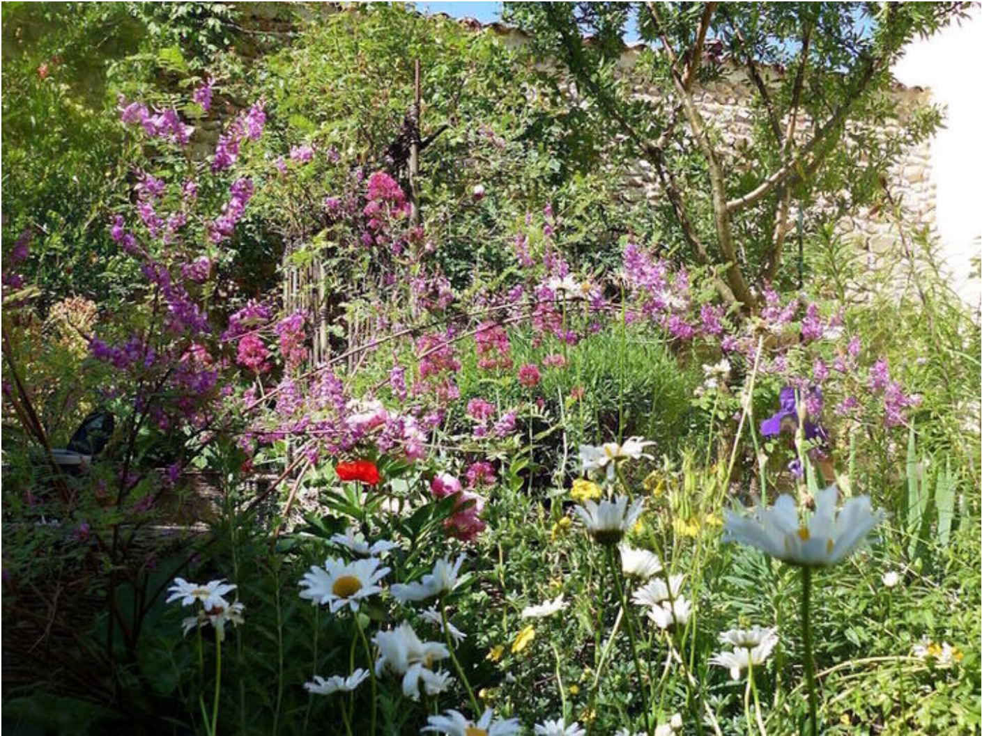
Le jardin médiéval 38160 Saint-Antoine-l'Abbaye Quatre jardins, quatre histoires, quatre haltes ponctuées de plantes exubérantes, d'herbes aromatiques, de fleurs et d'arbres fruitiers réunis par l'eau d'une fontaine et de bassins, élément inhérent et fondateur de l'essence même du jardin.