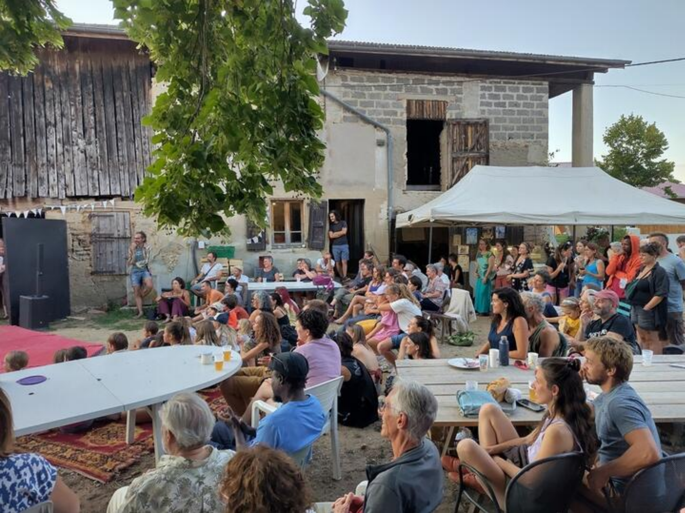
Assemblée générale de l'association le Sablier 38840 Saint-Lattier

L'association le Sablier, qui anime le marché hebdomadaire des Sablières, tient son assemblée générale 2026. Ce sera l'occasion de revenir sur la saison 2025 et les perspectives 2026, mais aussi de faire connaître l'association.